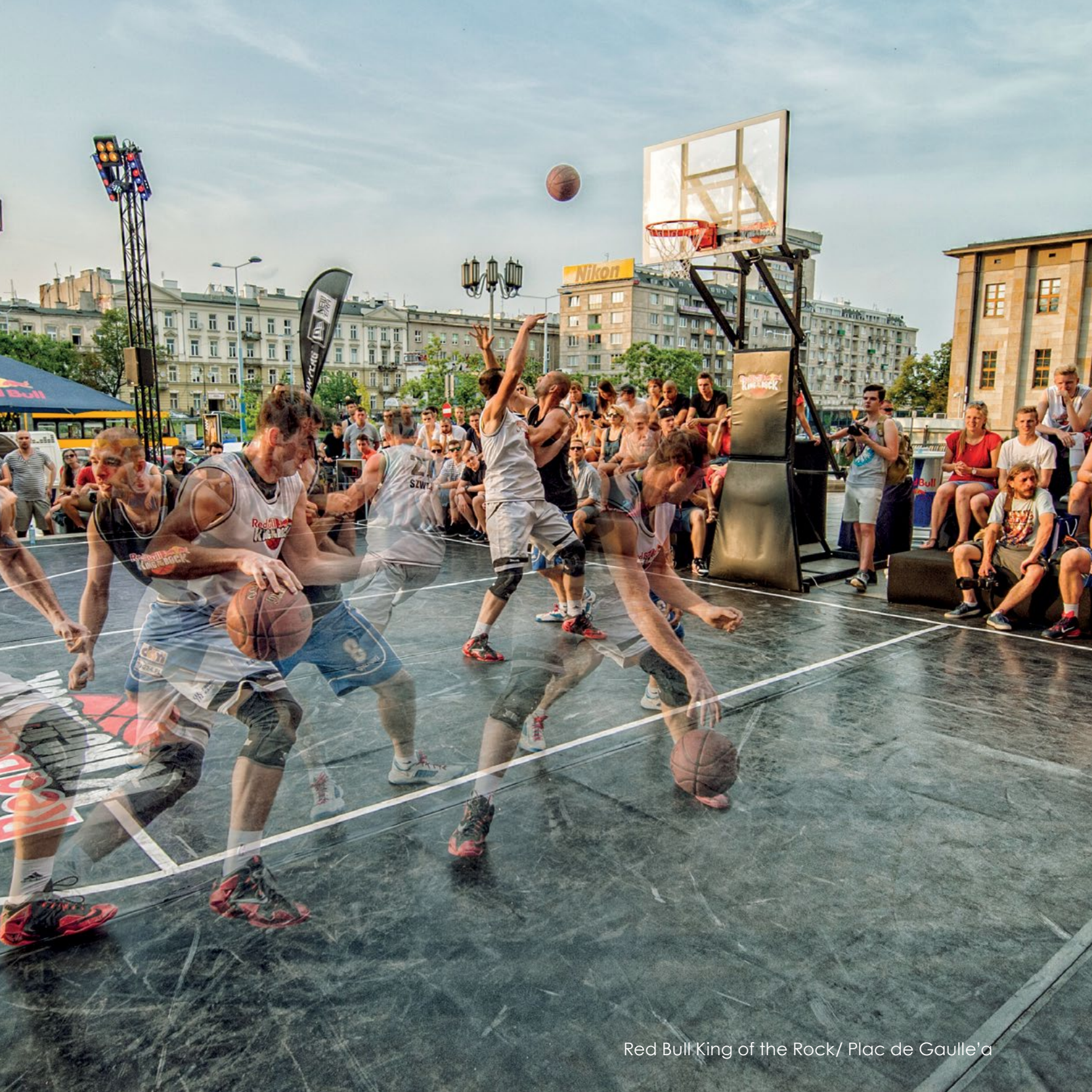
Red Bull King of the Rock / Plac de Gaulle'a